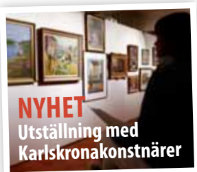
NYHET Utställning med Karlskronakonstnärer

76 fordon 52 porslins- montrar 1.800 kvm